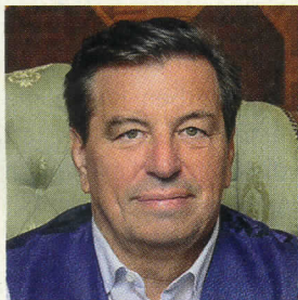
Összeállította: Kovács-Magyar András

Sorozatunkban Kovács-Magyar András és tanítványai – akik kapcsolatban állnak a szellemvilággal – mesélnek a praxisukban megtörtént esetekről.